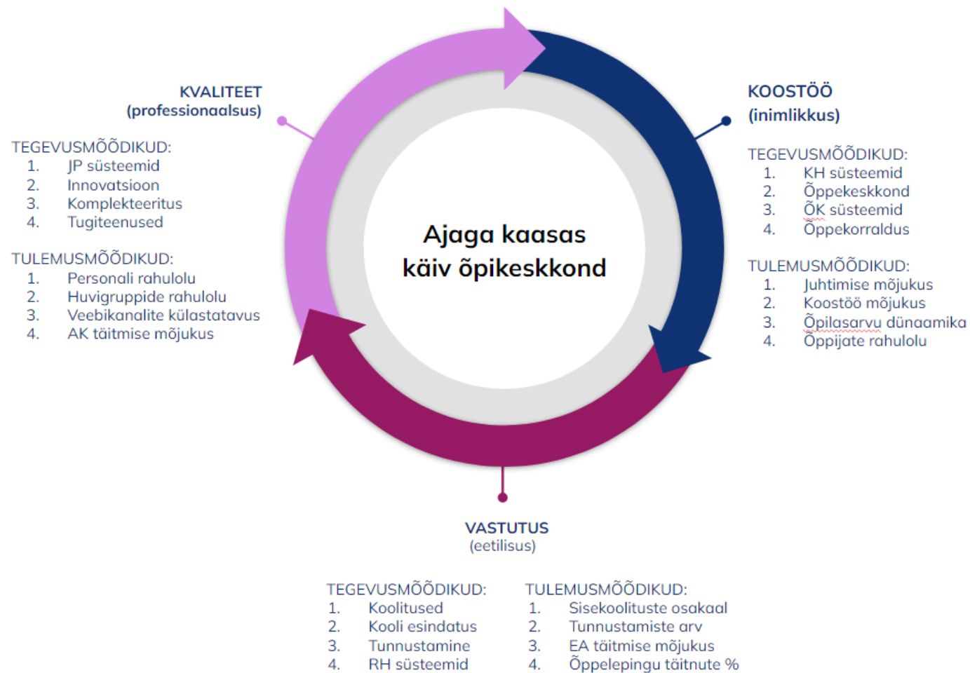
Joonis nr 2. Sisehindamise võtmenäitajad kooli põhiväärtuste kontekstis.