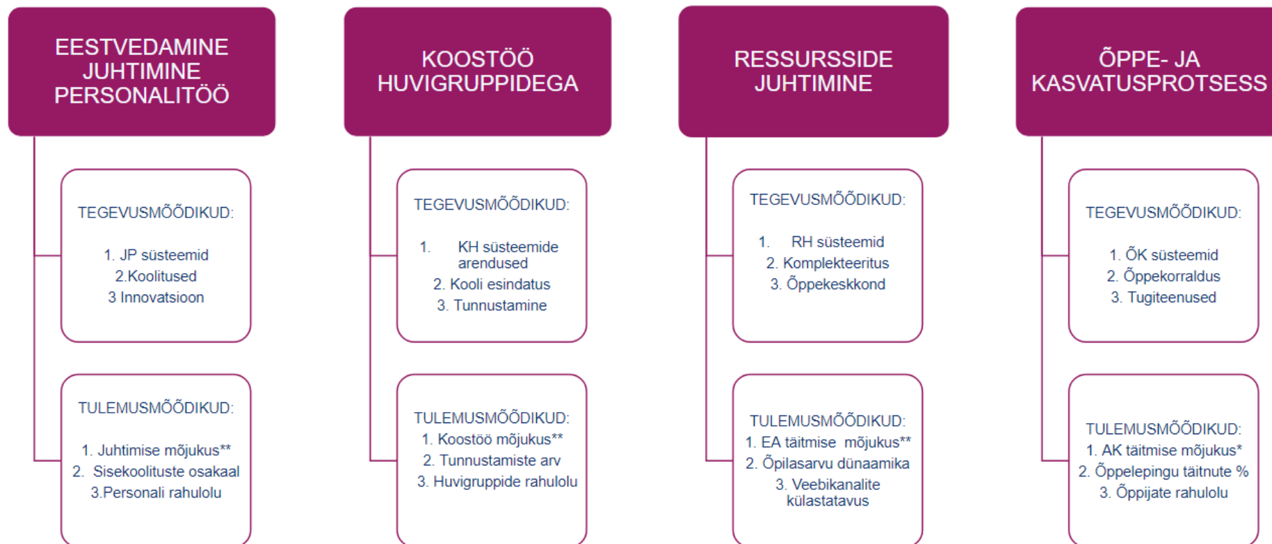
Joonis nr 1. Sisehindamise võtmenäitajad.